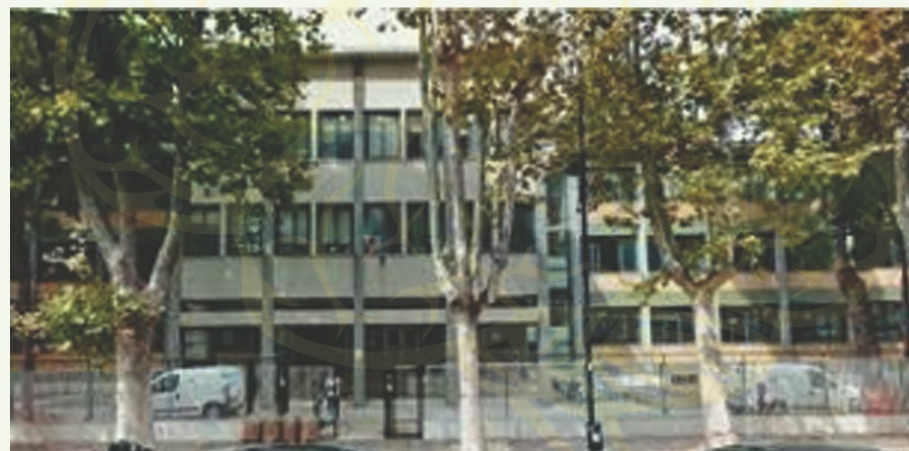
Plesso Infanzia via del Concilio: Dante Alighieri

L'elaborazione dei saperi necessari per comprendere l'attuale condizione dell'uomo, cittadino del mondo.