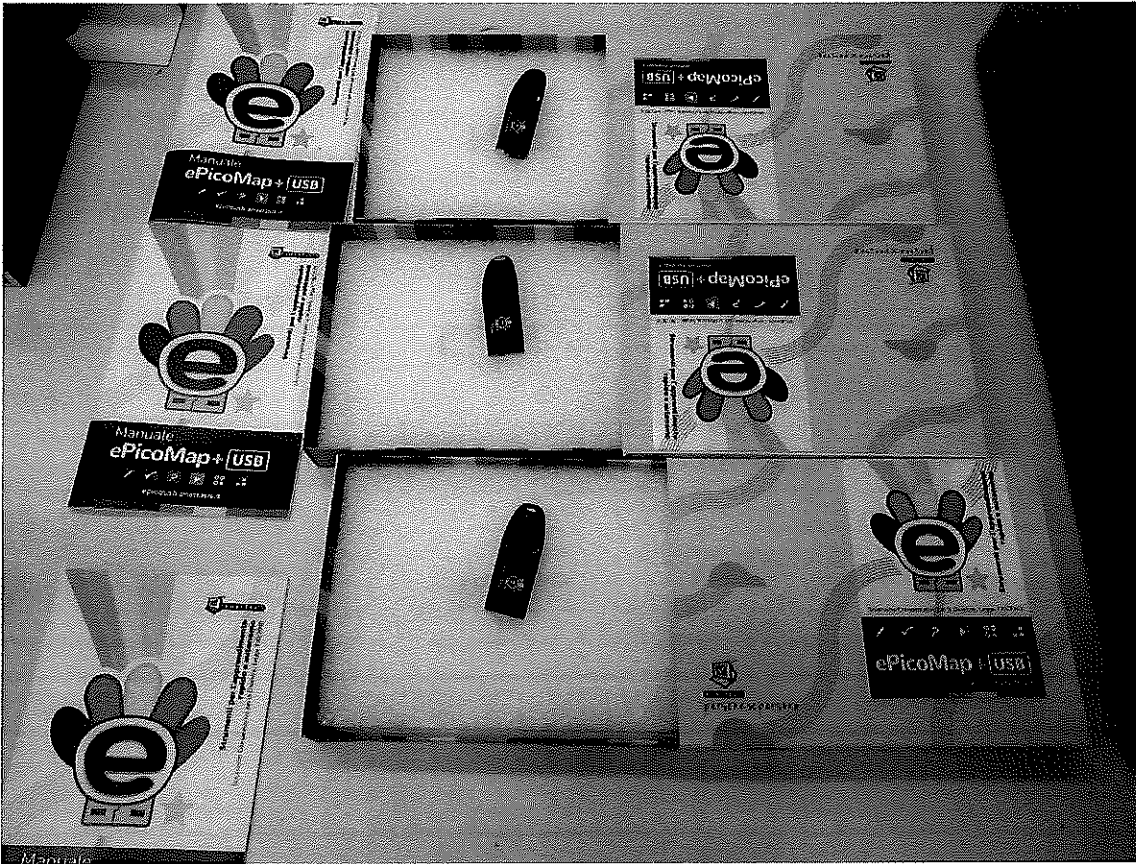
N° 3 PACCHETTO SOFTWARE ALUNNI BES EPICO MAP + USB + KIT SINTESI VOCALE MULTILINGUE