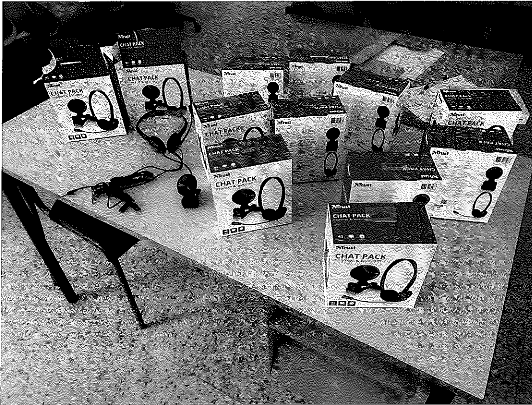
N°12COMPLETO CUFFIA CON MICROFONO E WEBCAM.