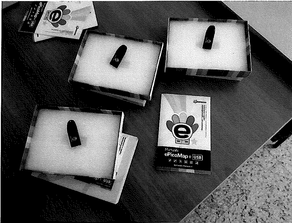
N° 3 PACCHETTO SOFTWARE ALUNNI BES EPICO MAP + USB + KIT SINTESI VOCALE MULTILINGUE